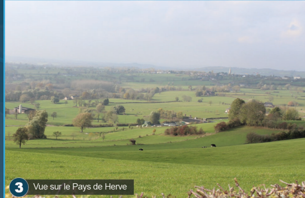
3 Vue sur le Pays de Herve