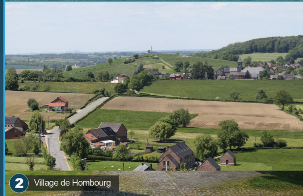
2 Village de Hombourg