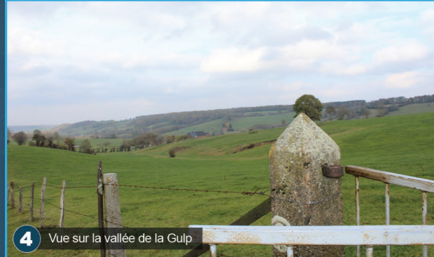
4 Vue sur la vallée de la Gulp