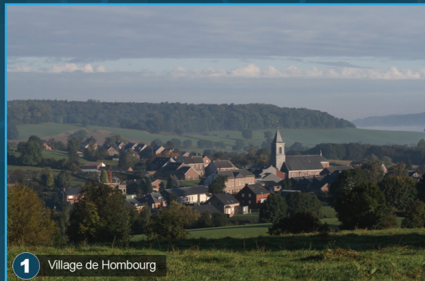
1 Village de Hombourg