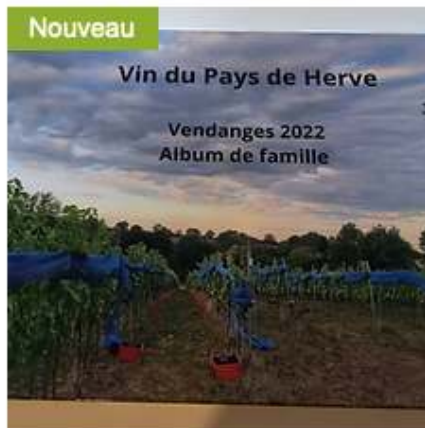
Livre Photos : vendanges 2022 30,00 €

Vous pouvez y acheter 2 livres photos : - un livre reprenant l'aventure de 2018 à 2020 - un livre sur les vendanges 2022.