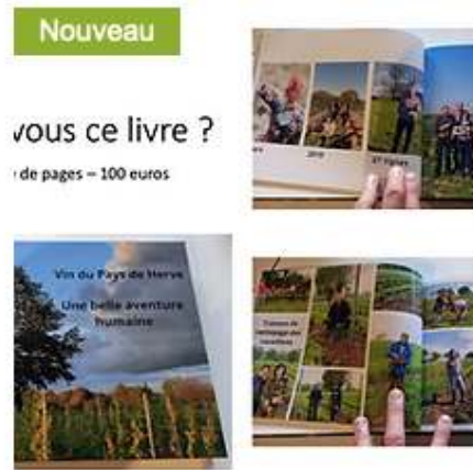
Livre Photos : Une belle aventure humaine 100,00 €